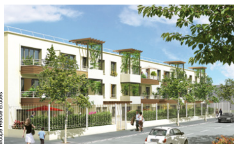
Groupe Renaudie Etudes