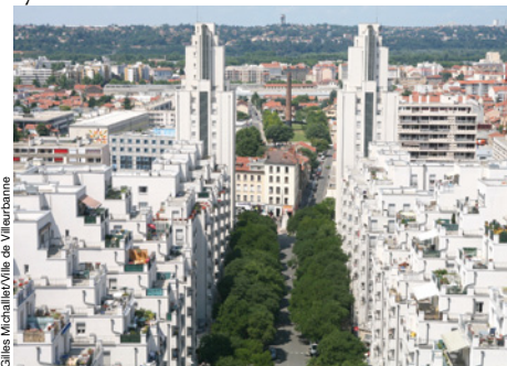
Gilles Michallet/Ville de Villeurbanne

Retour à la normale pour le marché lyonnais.